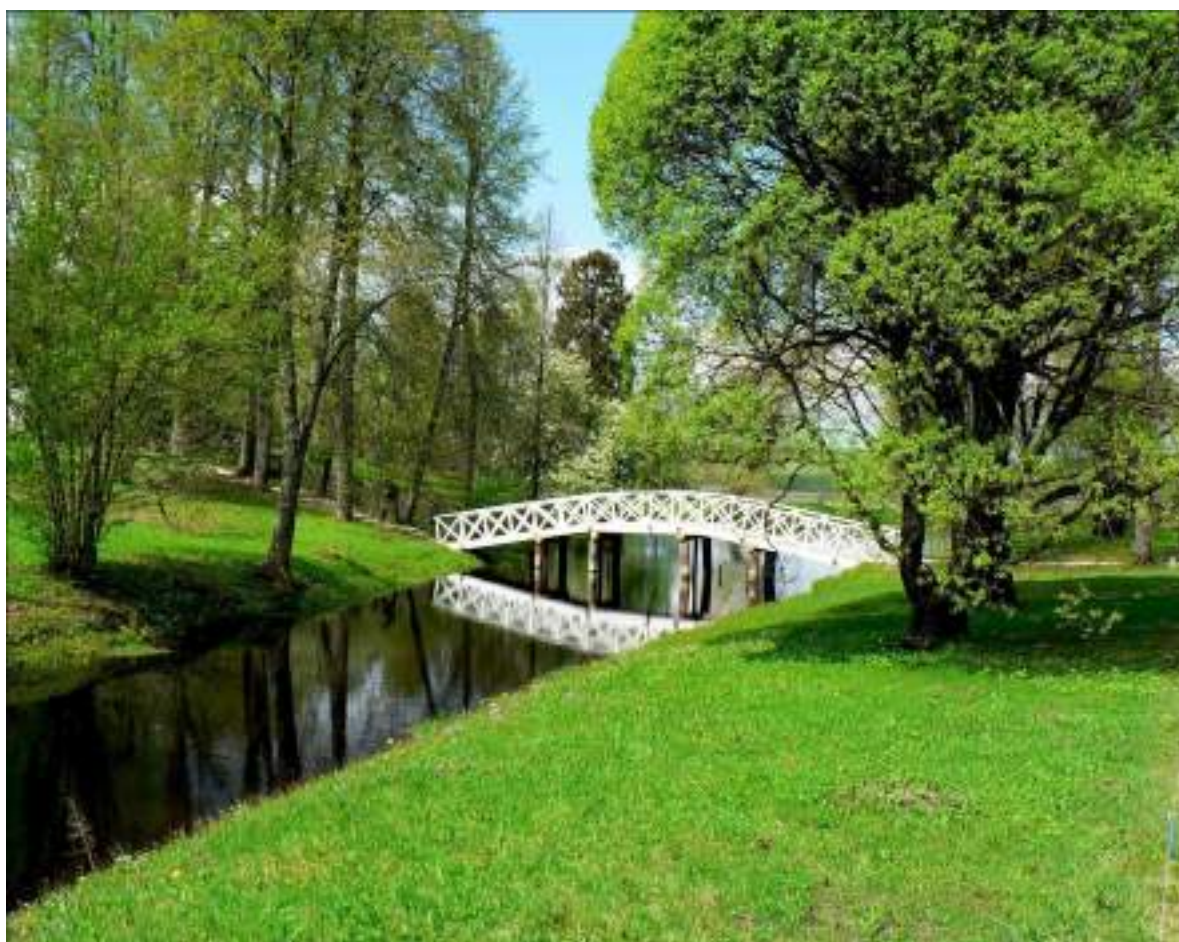
Парк в Михайловском

Как можно отметить этот день? Вопрос отчасти риторический. Вы это и без меня всё это прекрасно знаете: викторины, драматизации, театральные действия, конкурсы чтецов и рисунков по произведениям А. С. Пушкина, шарады, организация фотовыставок по теме дня – выбор за вами. А я предлагаю вам кроссворд, который можно провести с детьми именно сейчас, в период продолжающейся самоизоляции. Форма, доступная к проведению практически для всех, благо компьютеризованы нынче все. Организуйте и проведите такое мероприятие с детьми, вместе с родителями, как сочтете нужным. И главным условием решения этого кроссворда является знание сказок нашего классика. Удачи вам и вашим воспитанникам!