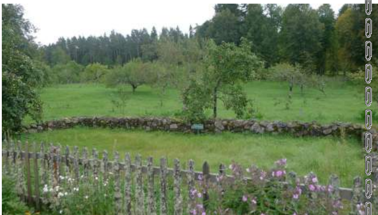
За околицей Михайловского у Сороти