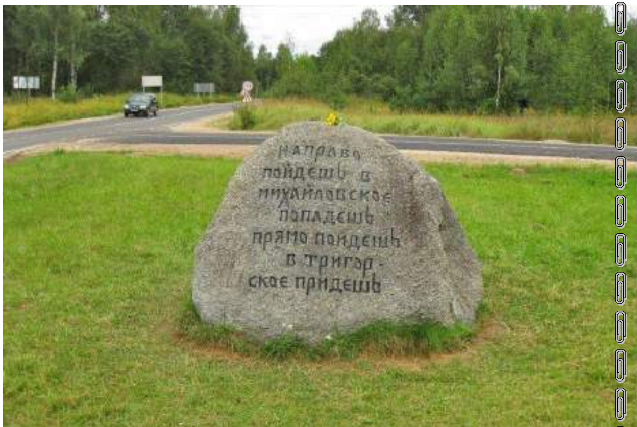
Указательный камень на развилке между Михайловским и Тригорским